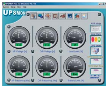
► Pantalla mediciones

Intuitivo software de monitorización mediante el cual se podrán visualizar los principales valores eléctricos del equipo (tensión y frecuencia de entrada y salida, niveles porcentuales de carga y baterías, etc.), preprogramar los retardos de actuación del shutdown en función del instante del fallo de red o de la batería baja, histórico semanal de eventos, gráficas de la evolución del sistema con el tiempo, etc.