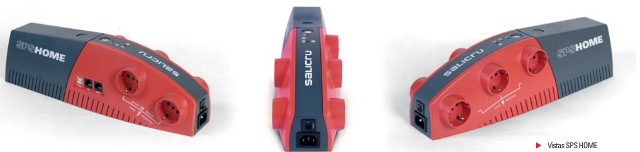
► Vistas SPS HOME

La comunicación y control del equipo están disponibles a través del puerto USB y un software de monitorización y gestión.